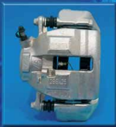
Třmen brzdy pokovený v lázni ZINNI AC AF 210