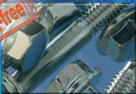
Spojovací materiál pokovený v lázni ZINNI AL 450T

Ucelený sortiment technologií Zn-Ni pro automobilový průmysl: