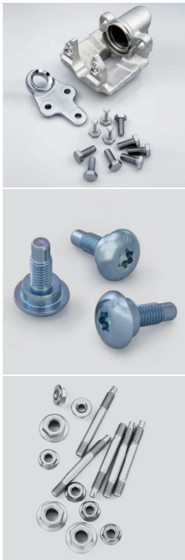
Bild 1-3: Zinni® 220 ist aufgrund höherer Schichtdicken im niedrigen Stromdichtebereich besonders geeignet für die Bremssattelindustrie. Zinni® 220 ist ebenfalls die richtige Wahl für viele andere Teile.